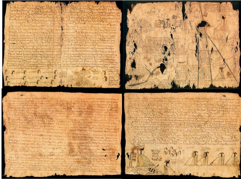
Figura 1: Ordenanza del señor Cuauhtémoc (composición de cuatro láminas).