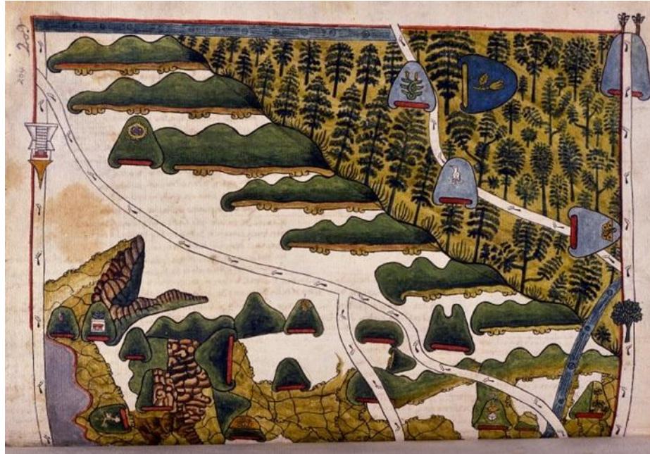
Figura 4: Códice de Tepetlaoztoc.

creados por el hombre. Podemos decir que pese a tener todo en contra, la naturaleza sigue su curso y recupera sus espacios.