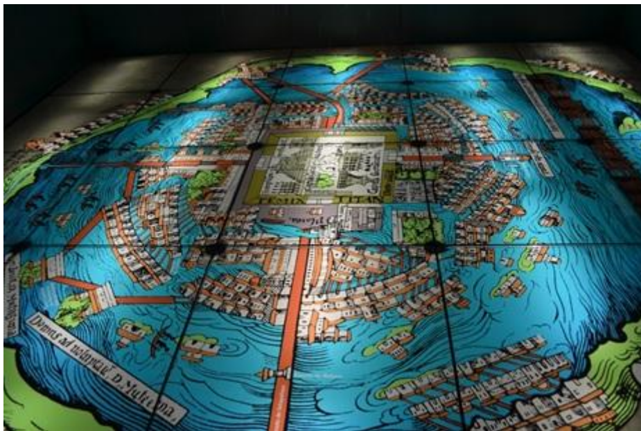
Figura 2: Plano de la Ciudad de Tenochtitlán o Mapa de Nuremberg de 1524.

Bernal Díaz del Castillo (1943, p. 50 apud MATOS, 2009, p.41)