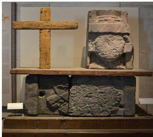
Figura. 8: La conquista española de México – Tenochtitlan.

Donde se encontraban trazadas calzadas-dique, acequias, canales, chinampas, albarradas, hoy se tienen calles, paseos y avenidas. Los registros escritos como la Ordenanza y las crónicas de conquistadores e historiadores, así como las pinturas plasmadas en la Caja de Agua, son testimonio de la reinterpretación de un paisaje, podemos afirmar que un paisaje es el rostro de un ecosistema, que pese a sufrir sucesiones, siempre quedan rastros (como pequeños nichos) visibles que dan idea de cómo era, años antes de sufrir cambios. “Toda conquista conlleva una reinterpretación del paisaje” 5 ya sea cultural o del agua.