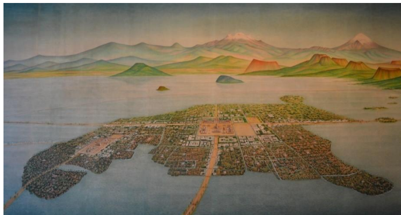
Figura 3: La isla de México en el siglo XVI (1962-1964).