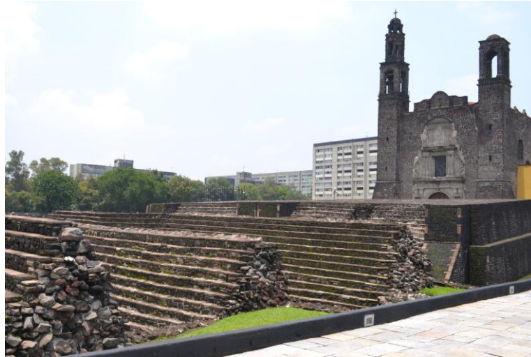
Figura. 7: Plaza de las tres culturas. Zona arqueológica de Tlatelolco. Ciudad de México.