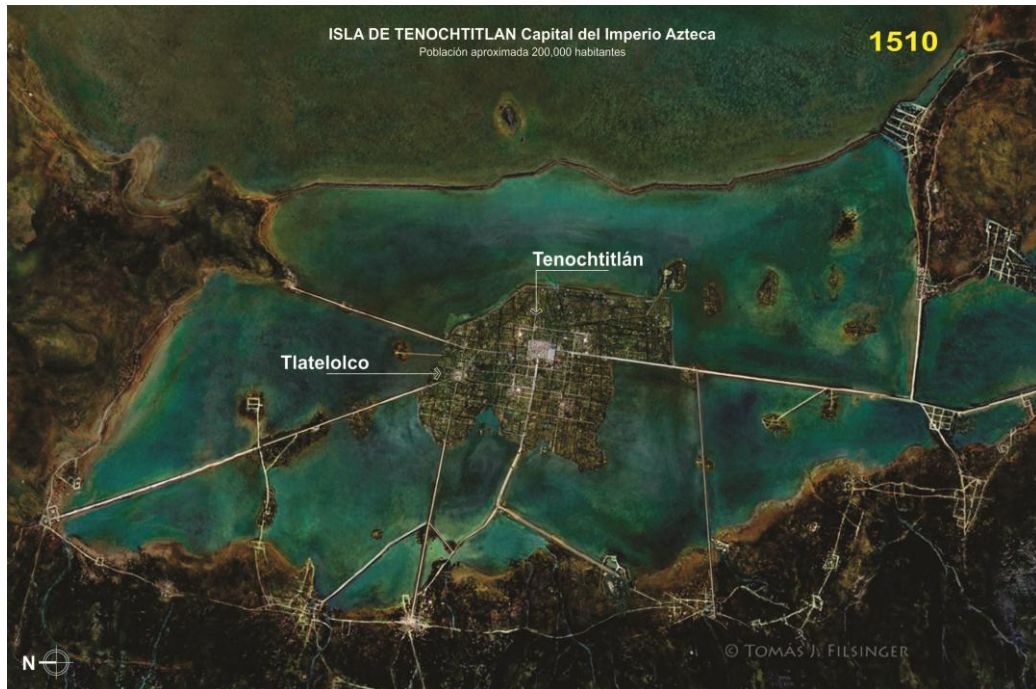
Figura 6: Isla de Tenochtitlan, 1510, Capital del Imperio Azteca.