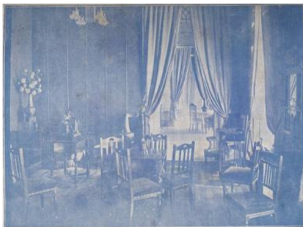
Figura 7: Um dos salões do Club Commercial