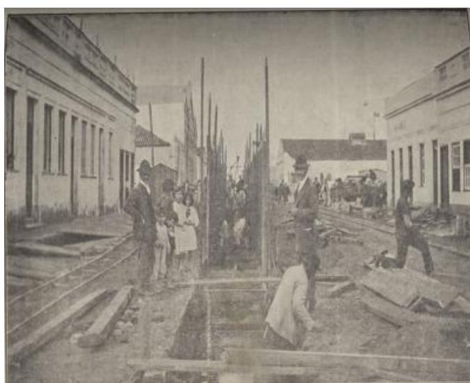
Figura 1: Escoramento para rede de esgoto

A fotografia da Figura 1 refere-se a uma obra sendo executada e nota-se, na cena, algumas pessoas trabalhando e outras tantas observando, evidenciando a notoriedade desta melhoria diante dos olhos da população.