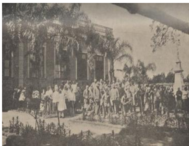
Figura 5: Grupo de recolhidos do Asylo de Mendigos