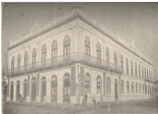
Figura 6: Fachada Club Commercial

destas fotos ocuparam o conteúdo de várias páginas e, também, um texto foi dedicado ao clube (CLUB..., 1920). O artigo destaca a sua fundação, em 1881, a visita da família Imperial em 1887, o número de 550 sócios e as reuniões elegantes e distintas. As fotografias mostram as possibilidades de interação social por ele proporcionadas, com tomadas que evidenciam sua escadaria, seu luxuoso mobiliário e seus amplos salões de bilhar, de leitura, de baile e de jogos, ilustrando-o, como um local de ócio e lazer. Chama a atenção no referido texto o fato de iniciar destacando o uso dos clichês para apresentar as dependências do “sumptuoso palacete” do clube, para que lá fora se tenha conhecimento do requintado gosto estético e cultural da cidade. Daí se supõe que o alcance da publicação dava-se para além dos limites locais, contemplando, deste modo, a busca por mostrar/ostentar a cidade moderna, civilizada, rica e elegante, assim delineada.