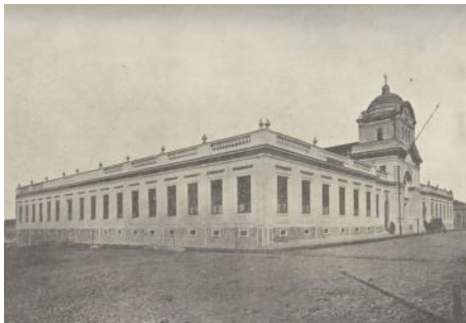
Figura 4: Vista geral do Asylo de Orphãs