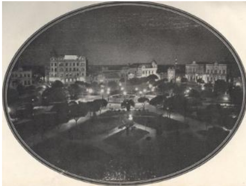
Figura 2: Iluminação na Praça da República

conforme referido na citação acima. Vê-se a praça banhada por luz elétrica, sendo tanto o espaço, quanto a tecnologia que a ilumina artificialmente, conotações da condição moderna.