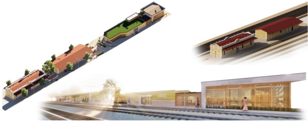
Figura 7. Intervenção em Estação Ferroviária - Grupo 1.

Diante das soluções propostas, o projeto poderia ser enquadrado na primeira categoria descrita por Carbonara, a de autonomia/dissonância, já que utiliza de materiais e soluções contemporâneas que divergem claramente da estação ferroviária, no entanto, essa divergência, embora evidenciada na porção mais extrema da nova edificação, está amenizada no bloco mais próximo da estação. Neste bloco intermediário identificamos uma postura que se enquadra como a relação dialética/reintegração da imagem, se aproximando de um subtipo de intervenção denominado filologia projetual/coextensão, em que a arquitetura preexistente é lida, interpretada, e reproposta com elementos advindos da “linguagem” percebida da edificação de referência. Tal dualidade, isto é, a presença de soluções que podem ser interpretadas como parte da primeira e da terceira categoria enumeradas por Carbonara mostra que suas categorias sintetizam diferentes abordagens projetuais possíveis, mas não determina que elas não possam coexistir numa intervenção.