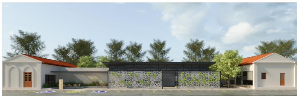
Figura 3. Intervenção em conjunto de armazéns de algodão de Sousa - Grupo 1.

A edificação nova apresenta-se em duas partes: de um lado, paredes cegas pintadas com a mesma cor das edificações preexistentes; de outro, na parte central, um bloco em estrutura metálica e envidraçada, cuja aparência mais contrastante é amenizada pelos cobogós implantados no plano da rua. Segundo os discentes, os cobogós, além de marcarem a luz e dar privacidade ao bloco mais permeável visualmente, também harmonizam a instância estética do conjunto.