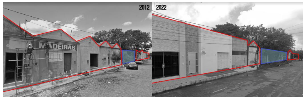
Figura 2. Conjunto de antigos armazéns de algodão em Sousa/PB – antes e depois, com destaque para a lacuna na quadra.

Um dos grupos que interveio nesta área optou por assumir o vazio existente, propondo uma nova ocupação recuada do leito da via e implantada no sentido longitudinal do lote – rompendo com a forma de ocupação histórica (casas estreitas e transversais à via) e reforçando a descontinuidade na leitura das fachadas. No entanto, posiciona, de forma intercalada, dois painéis de elementos vazados, a serem preenchidos com vegetação no plano vertical, de maneira que registre o limite frontal do lote e esconda a intervenção mais contemporânea aos fundos (figura 3).