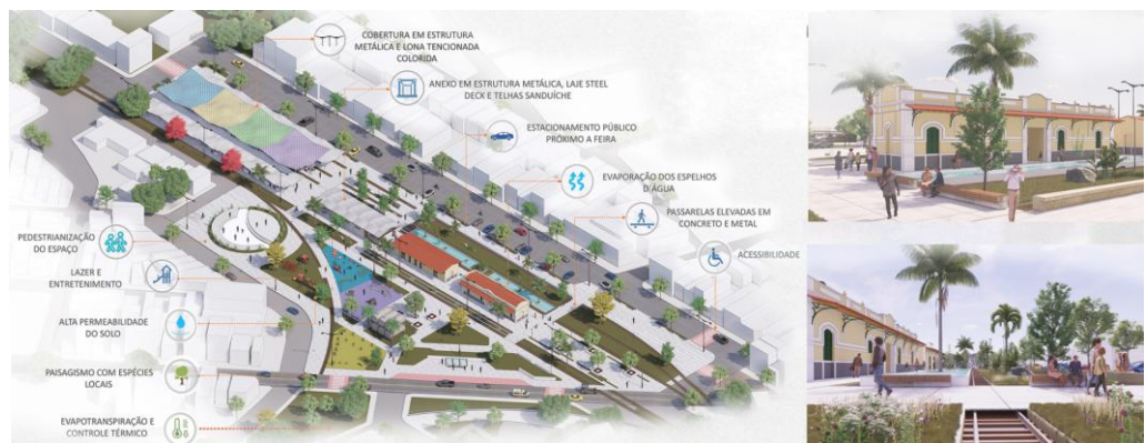
Figura 8. Intervenção em Estação Ferroviária - Grupo 2.

No segundo projeto temos uma leitura mais abrangente da área e uma intervenção que se interessou mais pelo impacto urbano. A proposta trabalhou, além das edificações históricas e a inserção de um anexo, toda a área vazia presente no entorno da estação. Para isso, os discentes realizaram um diagnóstico urbano e social com o intuito de detectar as demandas da área para pensar no espaço público de forma coerente. Assim, inseriram uma estrutura anexa (uma grande cobertura ondulada) para comportar a feira livre que acontece semanalmente na área e trabalharam o entorno com espaços de lazer (figura 8).