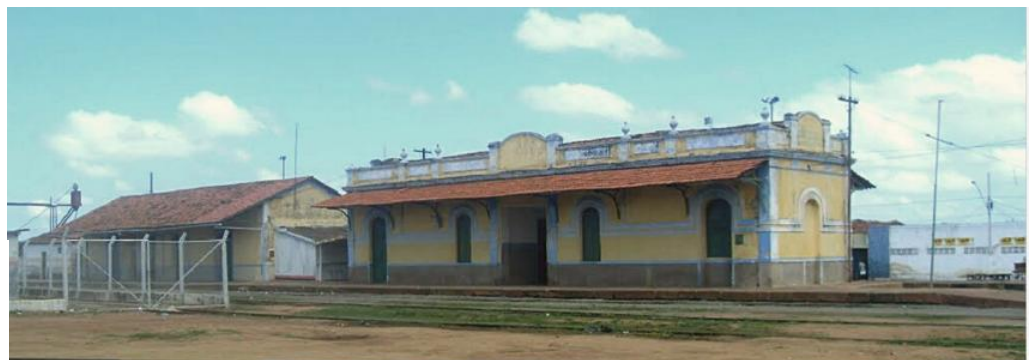
Figura 5. Estação Ferroviária de Sousa/PB.

O conjunto arquitetônico que configura a antiga Estação Ferroviária da cidade de Sousa/PB, está localizado na Avenida Almirante Tamandaré, no Bairro da Estação, zona oeste do município. A estação foi inaugurada no ano de 1926, e, segundo o levantamento realizado pelos estudantes, a partir de 2010 foi abandonada, sendo ocupada informalmente por moradores de rua e passando por um rápido processo de deterioração (Figura 5). As edificações que formam esse conjunto pertencem a tempos distintos e ambas estiveram por muitos anos envoltas por uma área extensa descampada e sem tratamento urbano que comportava semanalmente uma feira livre; além disso toda a área é tida como um nó urbano, convergindo fluxos de automóveis que desejam entrar ou sair da cidade.