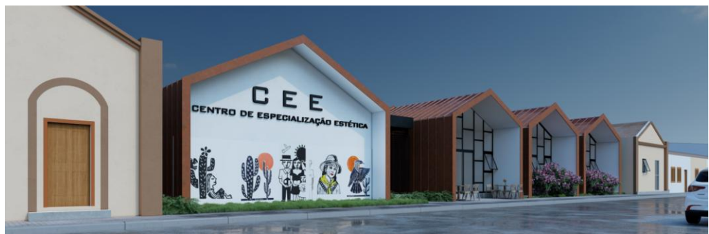
Figura 4. Intervenção em conjunto de armazéns de algodão de Sousa - Grupo 2. Fonte: Elaborado por discentes do semestre 2022.1.

A marcação das cobertas e a forma geral da intervenção remete ao passado, reforçando a imagem da área, mas o detalhe arquitetônico é indubitavelmente do presente, com estrutura metálica, que traz princípios projetuais bem legíveis e atuais: a modulação do pórtico, painéis amplos de esquadrias e a integração visual entre coberta e vedação lateral, em chapas de telha termoacústica (figura 4). Diferentemente da implantação geminada tradicional, os blocos foram propostos com afastamentos entre si, possibilitando a inserção de jardins e reforçando o desenho do partido adotado. Além disso, apesar da marcação do volume ocorrer no limite frontal do lote, os acessos são recuados e conseqüentemente, protegidos pela cobertura, diferente das edificações antigas, onde as portas abrem-se diretamente sobre as calçadas, demonstrando a preocupação de aliar forma e funcionalidade.