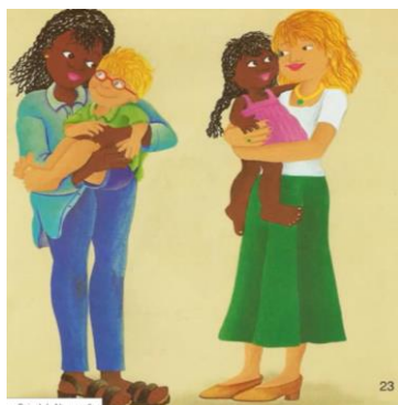
Figura 6 - Página 23 da obra A cor da vida . O reencontro com as crianças.

Na imagem acima, percebemos o caráter sugestivo desse discurso elaborado (ou a se elaborar), tanto nos pés descalços das crianças, que sugerem liberdade aos paradigmas e rituais sociais, quanto no fato das mães trocarem as crianças. Sugere também que algumas questões como o preconceito apenas as crianças são capazes de resolver com naturalidade, mas entre os adultos há muito a se fazer; ou, ainda, que a inocência infantil serve de exemplo para os adultos e que a verdadeira cor da vida é aquela que nos une: o amor e o respeito ao próximo. Aqui poderíamos até dizer que a obra torna-se de certa forma “utilitária”, ou seja, as imagens acabam forçosamente sendo utilizadas para demonstrar algo que já foi repisado desde o início da narrativa. Dito ainda de outro modo, a solução imagética encontrada foi a troca das crianças pelas mães, como se socialmente ambas tivessem, a partir de então, tomado toda a consciência de seus atos, atitudes ou preconceitos arraigados, o que, como sabemos, não é tão simples e banal quanto se quer fazer pensar.