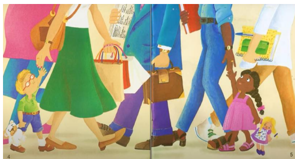
Figura 2 – Páginas 4 e 5, respectivamente. O primeiro encontro das crianças.

Do mesmo modo que a capa, a primeira e a segunda páginas da obra trazem cores alegres e vibrantes. Porém, neste caso, mais significativo que as cores, destaca-se o retrato da agitação do dia-a-dia das pessoas que ali transitam e que é muito comum às grandes aglomerações citadinas. A discursividade imagética não é aleatória ou acidental. Por meio das escolhas de tais elementos, a obra parece querer discutir uma inquietação própria da atualidade e uma certa coisificação do humano, além das notáveis diferenças nas classes e nas formas de vida. Repete-se a cor verde na saia da mãe do menino, a mulher parece carregar sacolas de compras, usa uma bolsa e caminha segura entre as pessoas. Já na mãe da menina, percebemos a predominância do azul. Ela usa calça, uma sandália confortável e carrega apenas um livro ou pasta como se estivesse a caminho do trabalho ou do estudo: