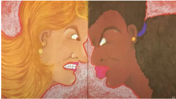
Figura 4 - Páginas 12 e 13, respectivamente. O embate das mães.

O que se destaca para o leitor é a defesa da construção de um novo status quo social: a igualdade por meio dos sentimentos infantis. Ao descobrirem o desaparecimento das crianças, indiferentemente da cor, as mães tem a mesma reação de susto e desespero: