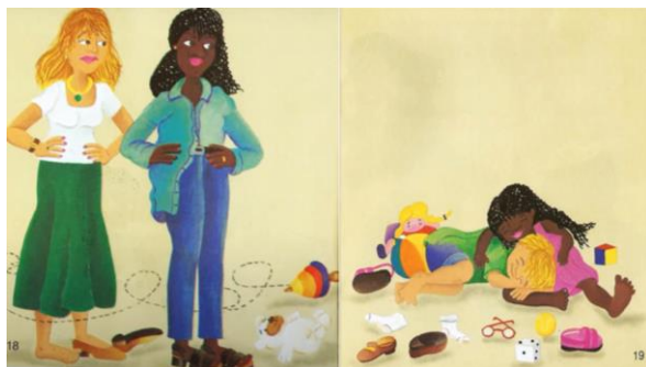
Figuras 5 - Páginas 18 e 19, respectivamente. As mães reencontrando os filhos.

Enquanto as mães estão numa posição de passividade em relação à cena e com expressões de desconforto, as crianças estão entrelaçadas, em total harmonia, com sorrisos nos rostos. A inexistência de palavras promove o sentido de íntima aproximação entre pensamento construído e pensamento projetado. Autor e leitor não precisam de um texto verbal interligando-os. Dito de outra forma, o signo verbal é dispensável e desnecessário, pois em se tratando de perceber e aceitar o outro, as imagens falam por si só.