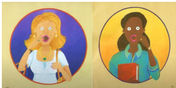
Figura 3 - Páginas 10 e 11, respectivamente.

Ao representar mundo adulto em contraste com a pouca autonomia infante e retratar uma conduta de duas crianças que desconsideram as barreiras sociais, a obra seleciona um tema universal e atual para discutir: o preconceito racial e de classe. Demonstra que o preconceito não nasce com o indivíduo, antes é condicionado a ele, seja por intermédio de palavras ou mesmo por ações ou reações, tanto do ambiente familiar, quanto da sociedade em geral.