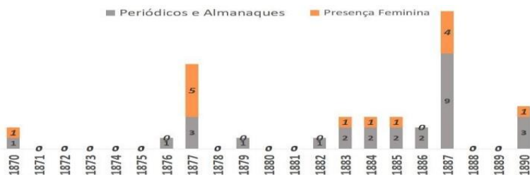
Figura 3. Gráfico acerca da presença feminina em periódicos e almanaques nos anos de 1870 a 1890 (não contando com as colaboradoras).

Mais um outro gráfico, abaixo, dá conta do comportamento modelar das periodistas de 1807 a 1890, pois conseguiram igualar-se nas funções e cargos ao outro sexo apesar das muitas dificuldades existentes. Podemos observar todas as funções por elas exercidas e, apesar de serem todas muito importantes, as de proprietária e directora eram de maior responsabilidade e poder. Na verdade, não foi fácil a conquista destas funções por mor da mentalidade vigente. Tudo era transgressão nesta época e é necessário ter sempre isso presente.