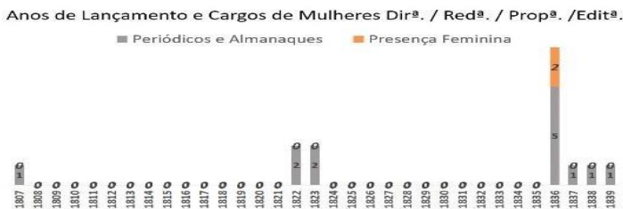
Figura 1. Gráfico acerca da presença feminina em periódicos e almanaques nos anos de 1807 a 1839 (não contando com as colaboradoras).

Até ao final de 1890 há um tímido ressurgir dos periódicos femininos para um aumento significativo como pode ser observado nos gráficos abaixo colocados.