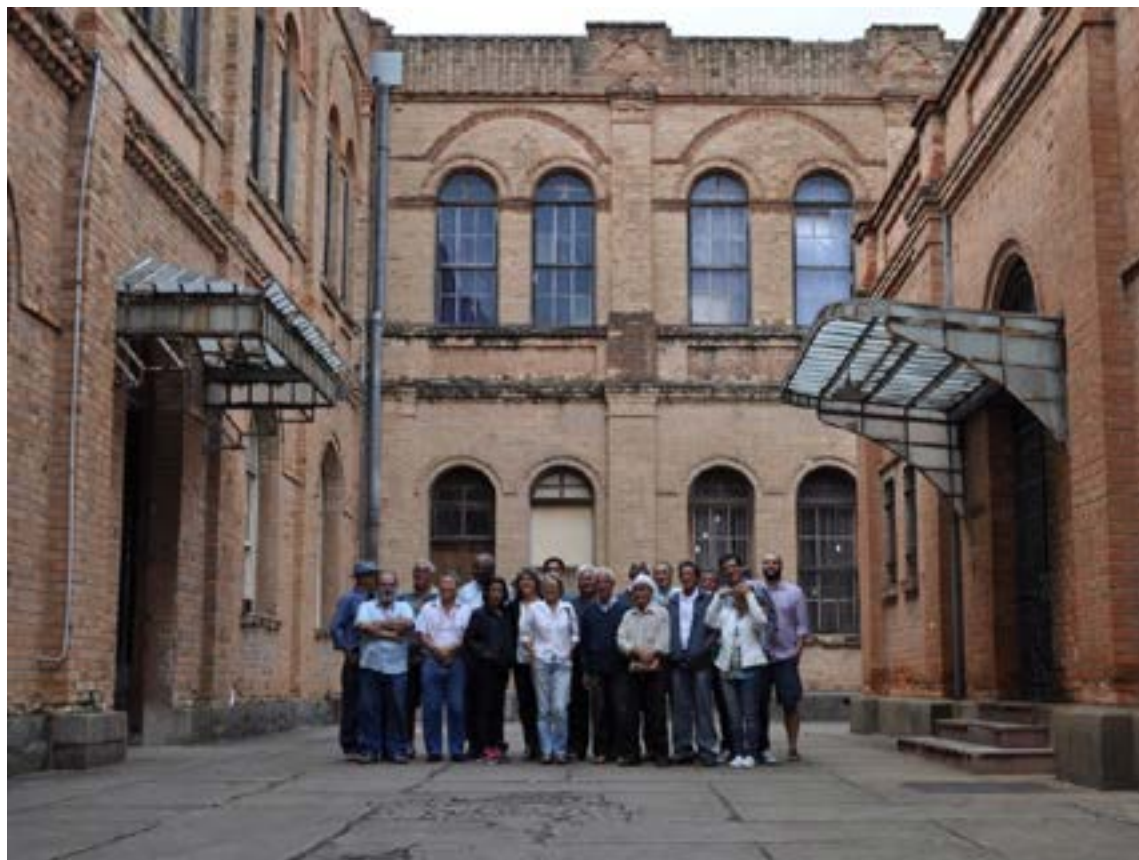
Figura 5 - Ex-ferroviários reunidos no Complexo FEPASA de Jundiaí durante o evento Café com trem , ocorrido em abril de 2015.