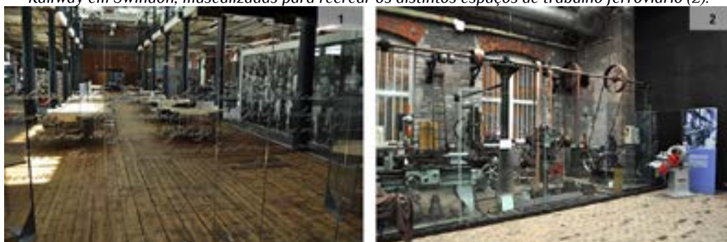
Figura 6 - Oficinas da Midlands Railway em Derby, reutilizadas pelo Derby College (1), e da Great Western Railway em Swindon, musealizadas para recriar os distintos espaços de trabalho ferroviário (2).