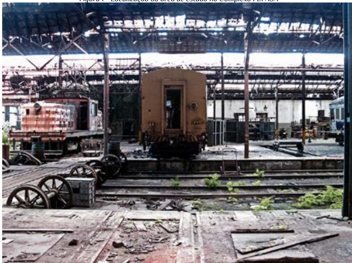
Figura 1 - Localização da área de estudo no Complexo FEPASA