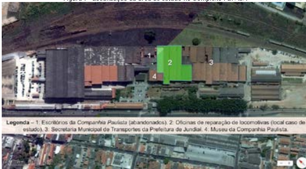
Figura 1 - Localização da área de estudo no Complexo FEPASA

Fonte: Elaborado pelo autor; imagem base: ortofotografia © Apple Inc. Mapas, com dados de TomTom e outros. Esta imagem já foi reproduzida em: CANO SANCHIZ 2014/2015, p. 291, Fig. 4.