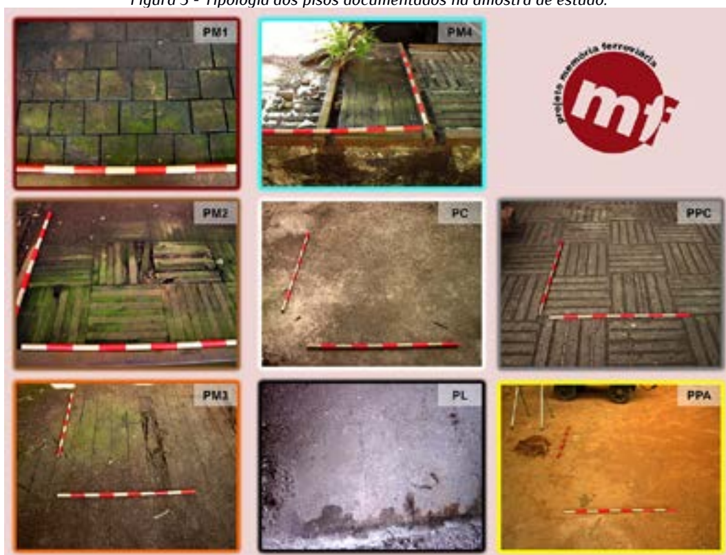
Figura 3 - Tipologia dos pisos documentados na amostra de estudo.